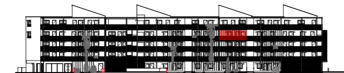
Repérage - Façade Nord :