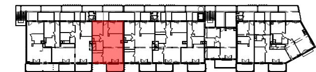
Plan de repérage - R+3 :

Les côtes et surfaces sont mentionnées à titre indicatif et sont susceptibles de variation dans les tolérances du contrat de réservation. Les gaines et les soffites sont mentionnées à titre indicatif et sont susceptibles de légères variations ou créations en fonction d'impératifs techniques ou administratifs. L'emplacement des éléments de cuisine et salles de bain est mentionné à titre indicatif. Les pointillés ne constituent pas du mobilier rentrant dans le cadre de la vente.