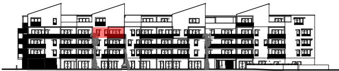
Repérage - Façade Sud :