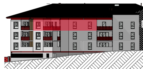
FACADE SUD-EST 1/500