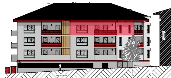
FACADE SUD-OUEST 1/500