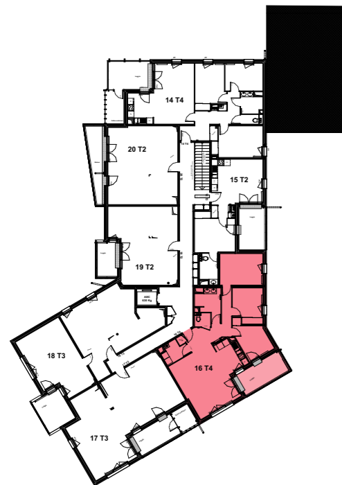
PLAN DE NIVEAU ÉTAGE 2 1/500