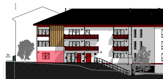
FACADE NORD-OUEST 1/500