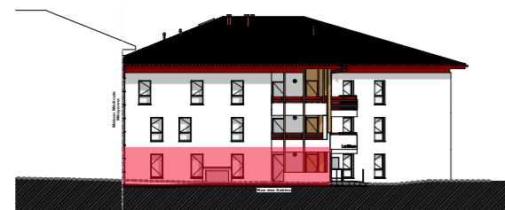
FACADE NORD-EST 1/500